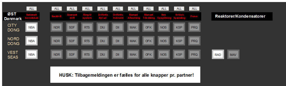
Figur 1 Nettelegrafen implementeret i ELKC - DK2.

I nedenstående billede er vist, hvordan nettelegrafen er implementeret i ELKC .